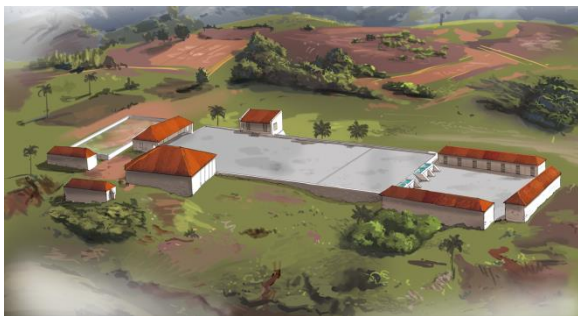
Maquette du projet de réhabilitation de l'Habitation Dion, présentée par la conférencière

travaux manuels. Les habitants des communes voisines sont souvent sollicités, a laissé comprendre l'oratrice. La construction de murs de soutènement, le nettoyage d'enduits etc... sont tant d'activités amenant à l'embauche de plusieurs habitants de la zone. La conférencière a tenu à préciser que les fonds utilisés pour les travaux d'aménagements de la Citadelle Henry proviennent de l'ISPAN, donc aucunes instances internationales n'y a participé. Les travaux ont été très bien faits et les résultats sont louables. Les visites de la Citadelle Henry sont désormais plus satisfaisantes, et l'aboutissement des travaux d'aménagements est palpable.