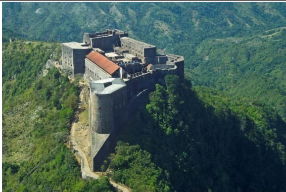
Photo de la Citadelle Henry, parmi les images projetées par Monique Rocourt

Madame Rocourt a par la suite fait mention du chantier de préservation, de réhabilitation et de mise en valeur de la Citadelle Henry. Dans un pays où le taux de chômage est si élevé, madame Rocourt affirma que ce genre de chantiers est très avantageux. Les emplois à court ou à long termes qui résultent de ce chantier, n'exigent pas de compétences pointilleuses. La maçonnerie, le travail du charpentier etc... sont tant de tâches qui ne nécessitent pas d'expertise particulière et qui rendent l'emploi très inclusif, d'autant plus que les haïtiens sont très talentueux dans les